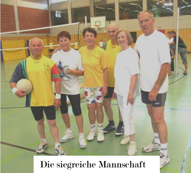
Die siegreiche Mannschaft